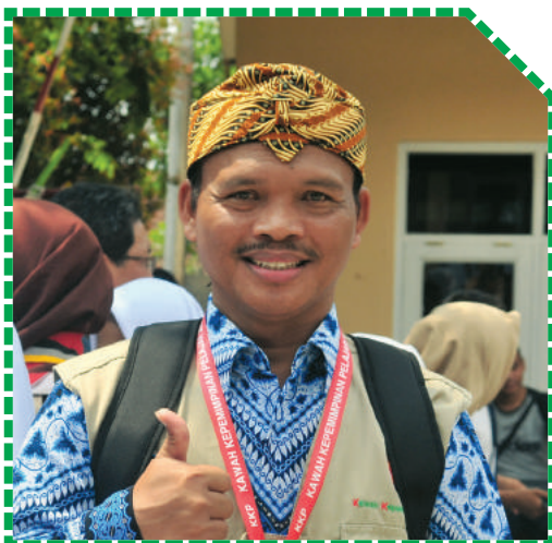
Sugimin Fasilitator KKP 2018