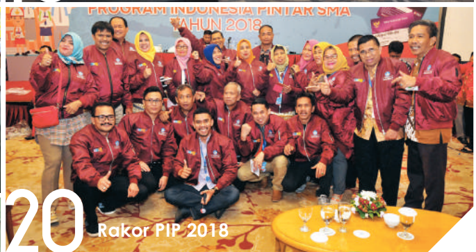
20 Rakor PIP 2018