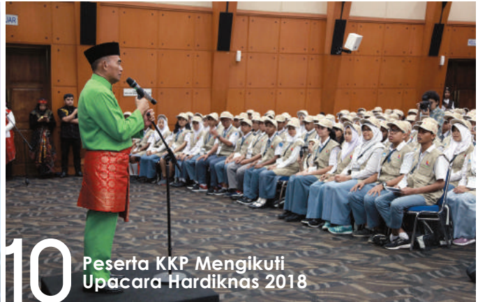
10 Peserta KKP Mengikuti Upacara Hardiknas 2018