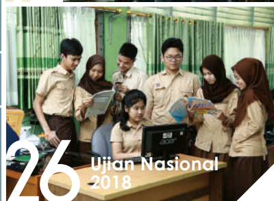
26 Ujian Nasional 2018

* FOTO-FOTO UN HANYA ILUSTRASI DAN DI PERAGAKAN OLEH MODEL