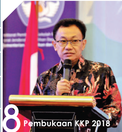
8 Pembukaan KKP 2018