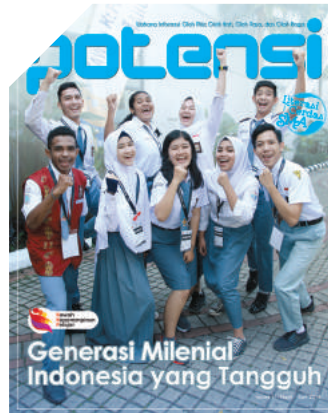
Generasi Milenial Indonesia yang Tangguh

FOTO COVER: EDDY SOFYAN DESAIN: EKA ARIF S.