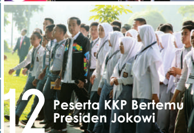
12 Peserta KKP Bertemu Presiden Jokowi