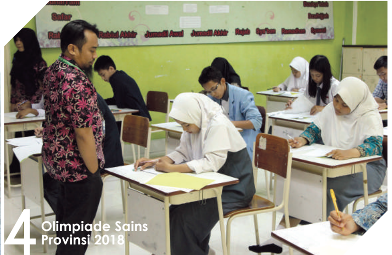
4 Olimpiade Sains Provinsi 2018